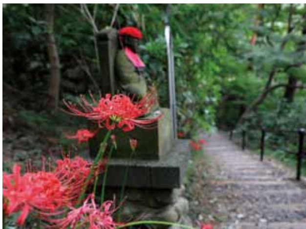
札所の弘法大師像と曼珠沙華(山内八十八ヶ所巡り)

今年の夏も連日厳しい暑さが続き、境内の草花も毎日たくさんの水を与えないと枯れてしまうのではないかと心配をしておりましたが、曼珠沙華は何とか耐えて花を咲かす準備をしております。例年9月上旬に咲き始めますが、桜やアジサイが早く咲き始めたので、曼珠沙華も早く咲いてしまうのではないかと気になるところです。昔から暑さ寒さも彼岸までと言われておりますが、曼珠沙華が満開になる頃には涼しくなって、大勢の参拝者が来山されることをお待ちしております。