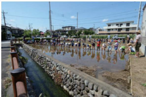
特選(日野市議会議長賞)