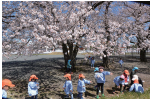
特選(日野市観光協会理事長賞)