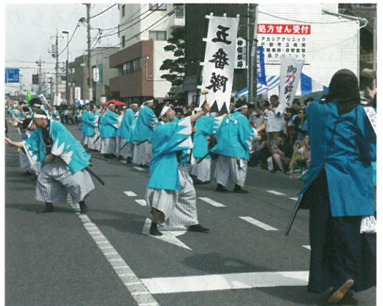
五番隊 日野自動車※