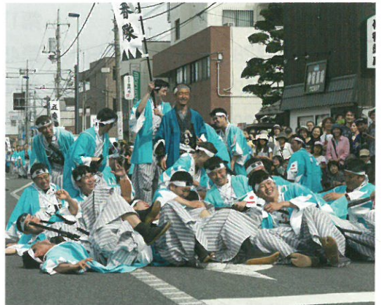
四番隊 多摩信用金庫※

5月7日・8日に開催されました「ひの新選組まつり」は晴天にも恵まれ、両日合わせて過去最大の47,000名ものご来場者を迎え入れる事が出来ました。精神・文化に比重を置いた高幡会場は益々安定感を増して来ましたし、甲州街道を通行止めにして4年目を迎える日野宿会場では、本年新たに第一小学校校庭並びに体育館をイベント会場として新設しました。年々地元の方々のご協力も増え、規模・質、共に充実して参りました。皆様のご尽力により、隊士パレードも過去最大の人数となり、出陣から帰陣まで無事に進行する事が出来ました。来年は20周年となります。引き続きのご協力をお願い致します。 (まつり推進部 三浦)