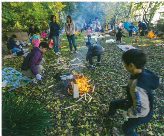
特選 (日野市観光協会理事長賞) 「初挑戦、焼き芋」 設楽 誠一