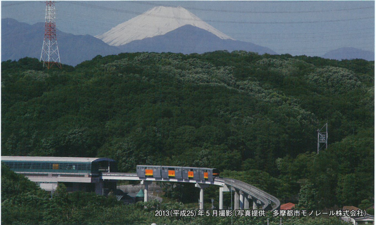
2013(平成25)年5月撮影