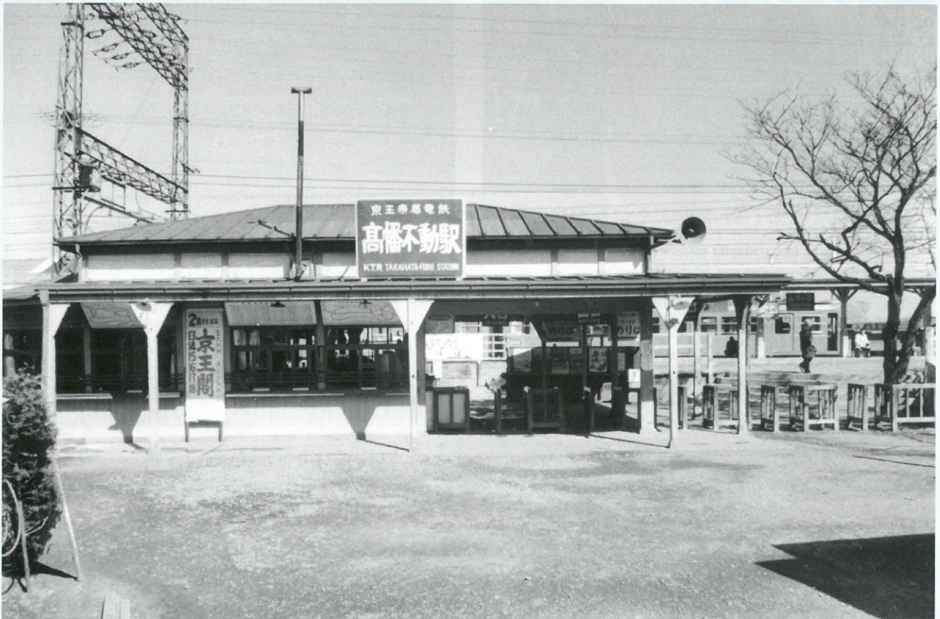
1960(昭和35)年2月撮影

特定非営利活動法人 日野市観光協会 http://www.shinsenhino.com/