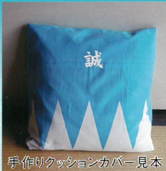
手作りクッションカバー見本