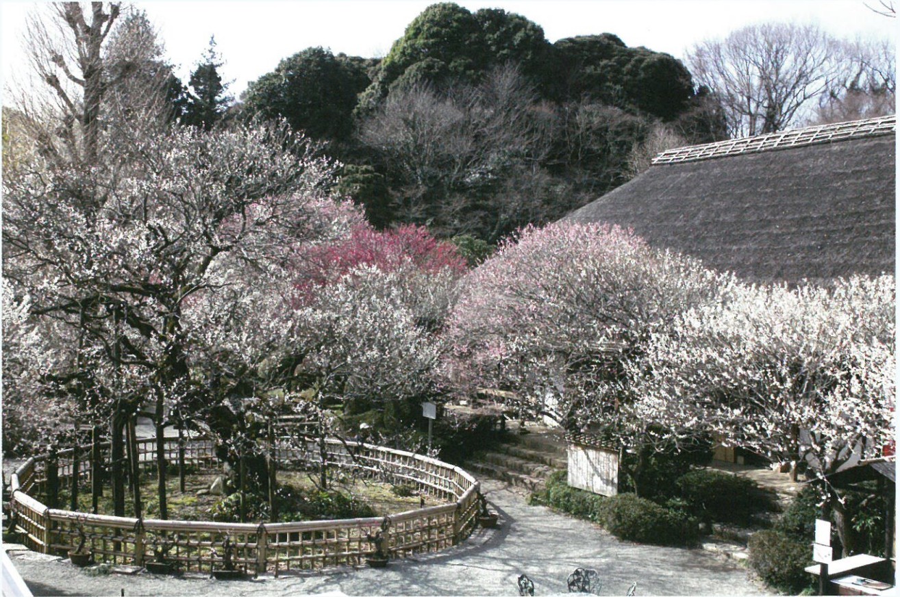
京王百草園 (茅葺屋根の松連庵)

特定非営利活動法人 日野市観光協会 http://www.shinsenhino.com/