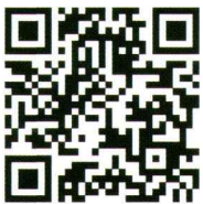
毘沙門天大祭 お札の申し込み