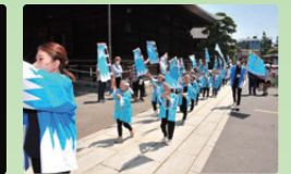
保育園児新選組パレード