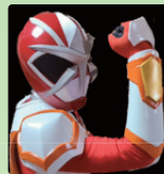
バスターフラッシュ