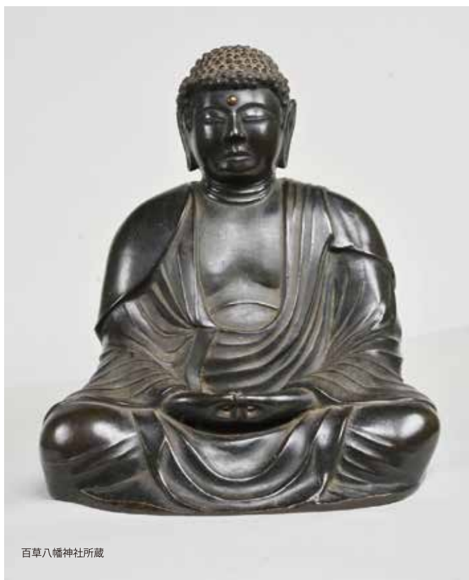
百草八幡神社所蔵