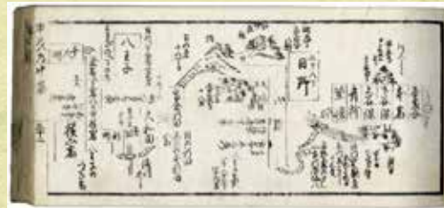
五海道中細見記（日野市所蔵）