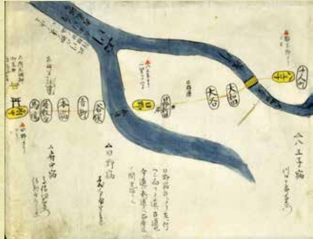
従高遠江戸マデ道中記

この展示が、甲州道中日野宿と日野宿本陣の歴史的・文化的な価値を再認識する契機となれば幸いです。