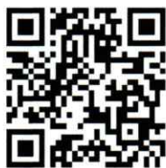
毘沙門天大祭 お札の申し込み