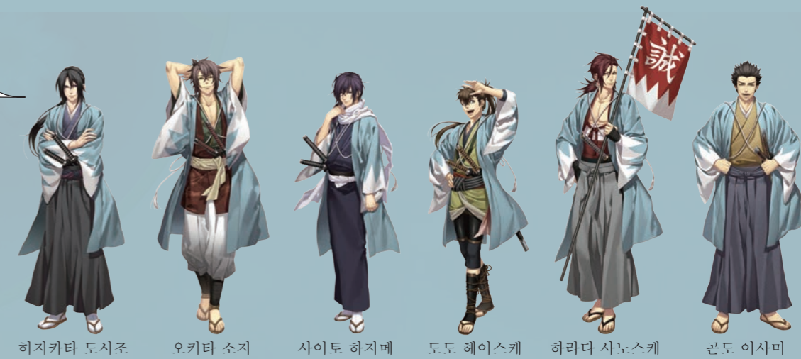
히지카타 도시조 오키타 소지 사이토 하지메 도도 헤이스케 하라다 사노스케 곤도 이사미

신센구미의 역사적 사실을 바탕으로 현대에 재탄생된 애니메이션이 바로 '박앵귀(薄桜鬼)'이다. 히노시는 신센구미 부장인 나, 히지카타 도시조가 태어나고 자라난 곳이다.