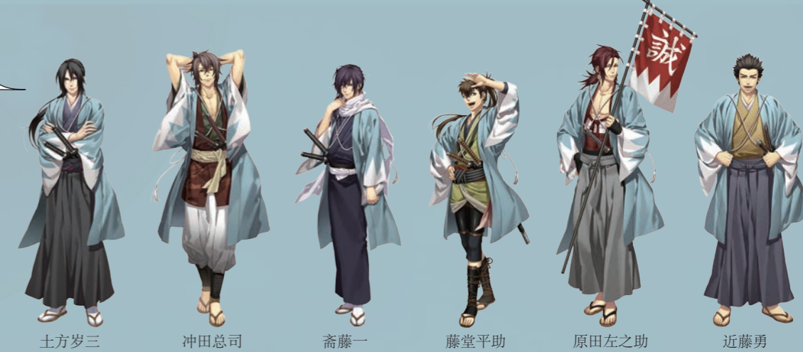
土方岁三 冲田总司 斋藤一 藤堂平助 原田左之助 近藤勇

《薄樱鬼》是以新选组的传说为蓝本,将这段历史重现于当代的动画作品。日野市就是我,新选组副团长土方岁三出生成长的地方。